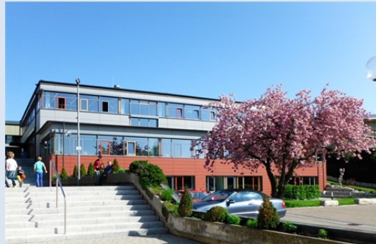
Grundschule Tapfheim Schulstraße 8 86660 Tapfheim