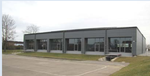
Angegliederte Dreifachturnhalle als Ausstellungsraum